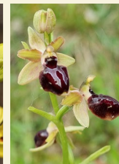
Ophrys passionis abellera de la Passió