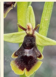
Ophrys subinsectifera mosquera petita