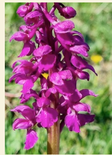
Orchis mascula orquis mascle, lliri de prat