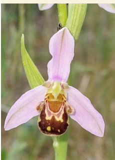
Ophrys apifera flor d'abella