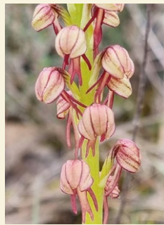
Orchis anthropophora flor de l'home penjat