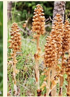
Neottia nidus-avis magraneta borda