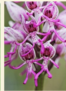
Orchis simia monetes, flor del simi