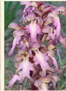
Himantoglossum robertianum mosques grosses