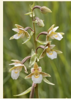
Epipactis palustris epipactis de mollera