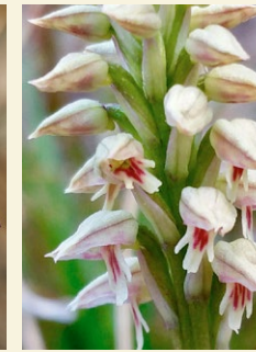
Neotinea maculata caputxina tacada