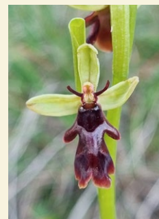
Ophrys insectifera mosquera