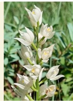
Cephalanthera longifolia curraia blanc