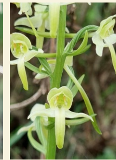
Platanthera chlorantha platantera de muntanya