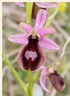
Ophrys montserratensis abellera catalana