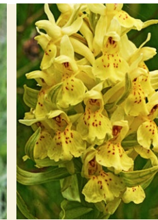
Dactylorhiza sambucina orquis sambuci