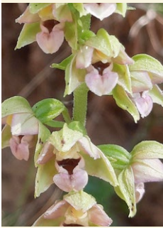
Epipactis helleborine epipactis de fulla ampla