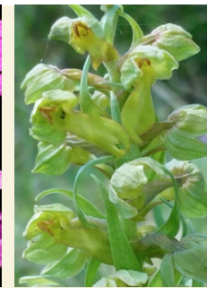
Coeloglossum viride orquis verd