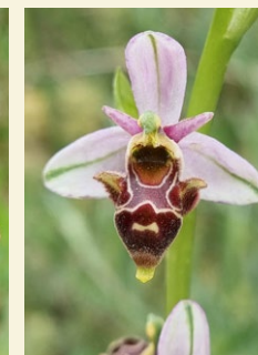
Ophrys scolopax abellera becada