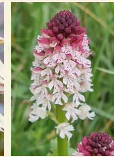
Neotinea ustulata orquis socarrat