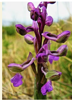
Anacamptis morio pentecosta