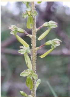
Neottia ovata listera ovada