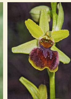
Ophrys sphegodes abellera aranyosa