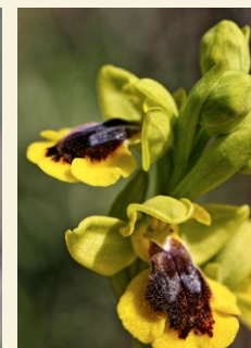
Ophrys lutea abellera groga