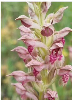
Anacamptis fragrans abellera olorosa