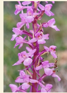
Gymnadenia conopsea caputxina olorosa