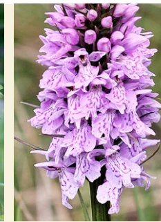
Dactylorhiza fuchsii orquidia rosada