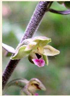
Epipactis kleinii epipactis de Klein