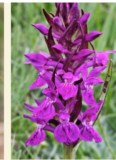
Dactylorhiza majalis orquis majenc