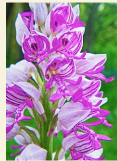
Orchis militaris soldadets, orquis militar