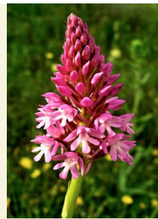
Anacamptis pyramidalis caputxina, barretet