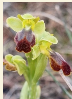
Ophrys forestieri abelletes, abellera fosca