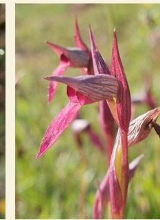
Serapias lingua galls