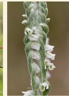
Spiranthes spiralis campanetes de tardor