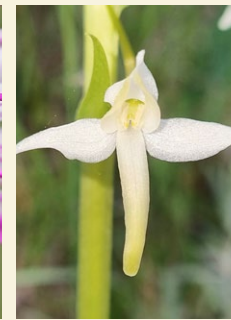
Platanthera bifolia platantera bifolia