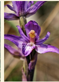
Limodorum abortivum clavell violaci